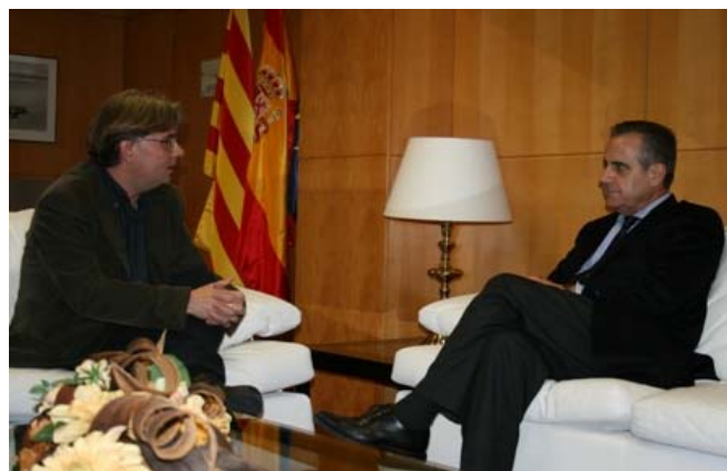
El ministro, en un momento de la entrevista, con el autor de la misma, en la sede del Ministerio de Trabajo e Inmigración en Barcelona.

La tendencia de la que hablábamos al principio, de reducción de la siniestralidad laboral durante esta década, es un éxito colectivo, reflejo del esfuerzo realizado por todos los profesionales implicados en la prevención de riesgos laborales: las administraciones, los agentes sociales, los traba-